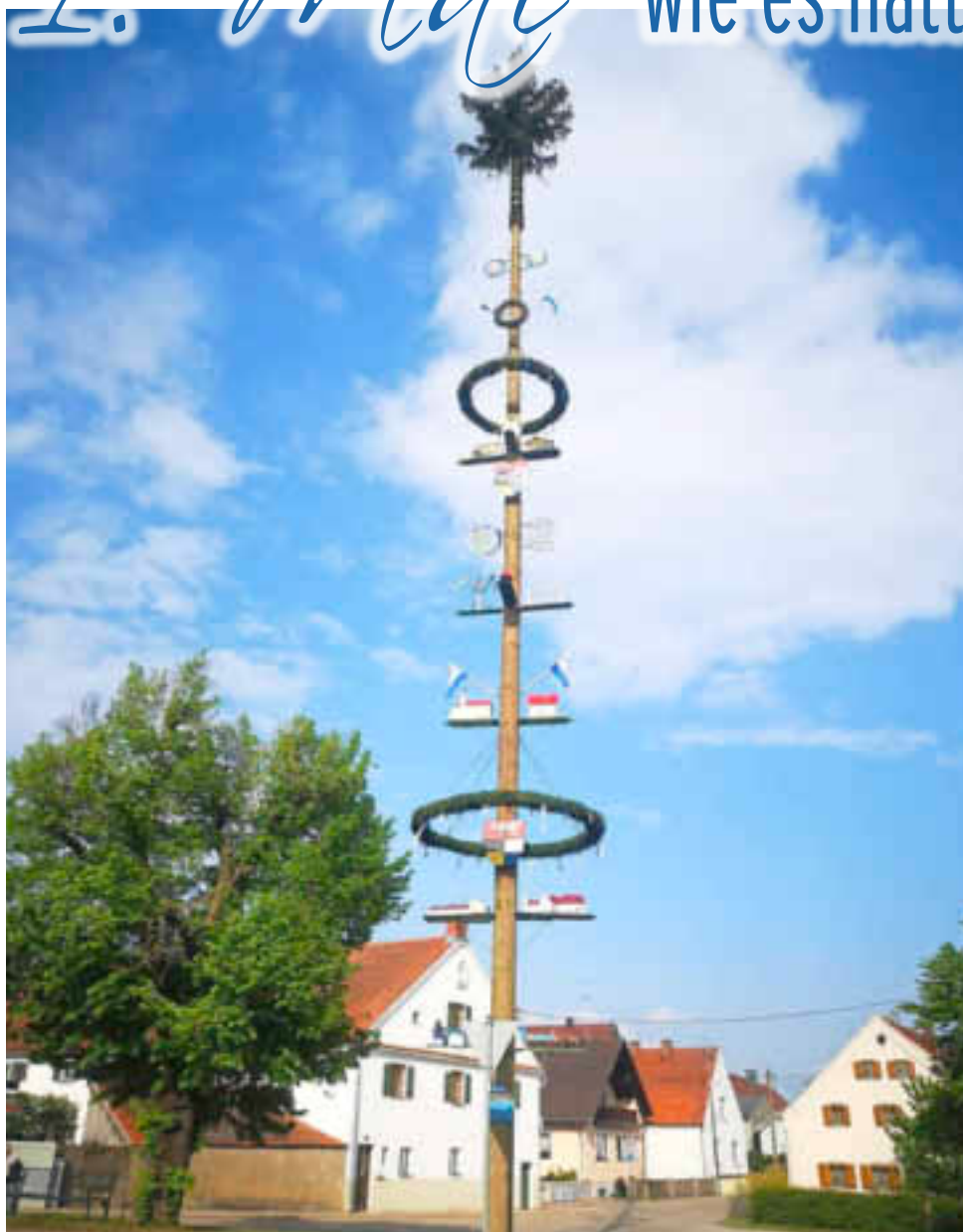
Maibaum Rohrenfels 2019