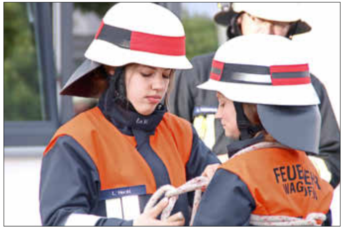
Teil II: Aufbau eines Löschangriffes

Zum bestandenen Leistungsabzeichen beider Gruppen gratulieren wir recht herzlich.