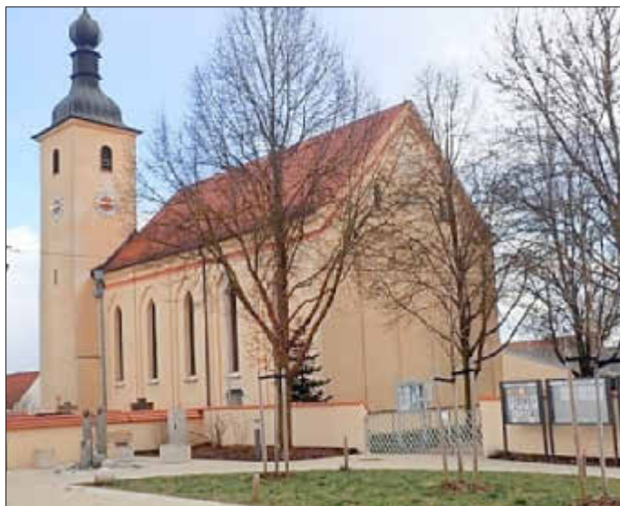
Mariä Heimsuchung Rohrenfels