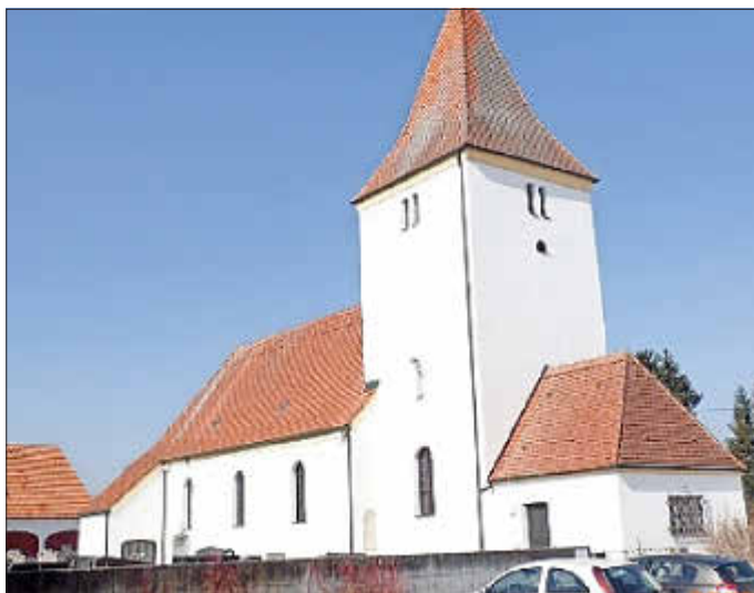
St. Martin Wagenhofen