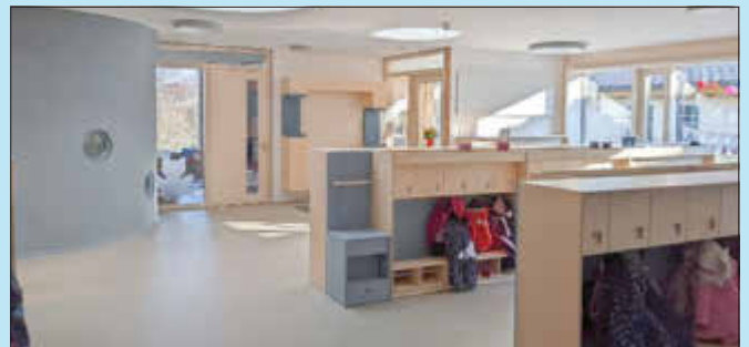
Garderoben mit Vitrine