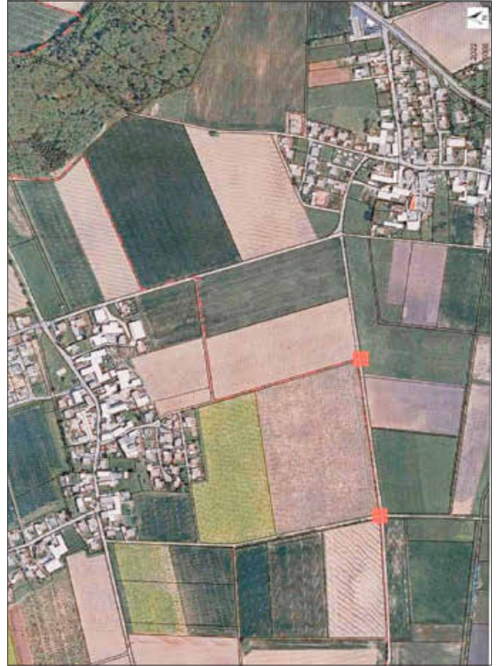
Auszug Vermessungsamt Ingolstadt

Die Verwaltung weist darauf hin, dass im März mit dem Bau des geplanten Solarparks in Ballersdorf begonnen wird. Derzeit laufen die Vorbereitungsarbeiten auf dem Grundstück. Die Bauzeit ist bis Ende Juni angesetzt. In dieser Zeit wird es in Wagenhofen und auf der Verbindungsstraße nach Ergertshausen zu vermehrtem LKW-Verkehr kommen. Mit dem Bau der Module werden auch die notwendigen Stromleitungen im öffentlichen Grund verlegt. Es kommt daher zu Verkehrsbeeinträchtigungen auf den entsprechenden Wegen und Straßen.