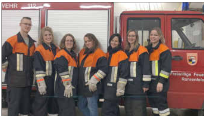
Die FFW Rohrenfels begrüßt ihre neuen Kameradinnen und Kameraden.

Wenn auch du Lust hast, bei uns mitzumachen, schau doch einfach vorbei. Wir treffen uns jeden 1. Mittwoch im Monat um 19:30 Uhr am Feuerwehrhaus in Rohrenfels zur Übung.