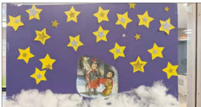
Ein Lichtermeer zu Martins ehr.

Natürlich dürfen die hell leuchtenden Laternen nicht fehlen. Gruppenintern wurden neue Martinslieder geübt und zum St. Martinsumzug gesungen und begleitet. Laternen wurden gestaltet. Warum feiern wir St. Martin? Was steht im Mittelpunkt von St. Martin? Wir teilen - wir teilen mit unseren Freunden, Familienmitgliedern, Verwandte oder Bekannten. Etwas Gutes tun und ein Licht des Lichtermeeres weitergeben und in die Welt hinaustragen.