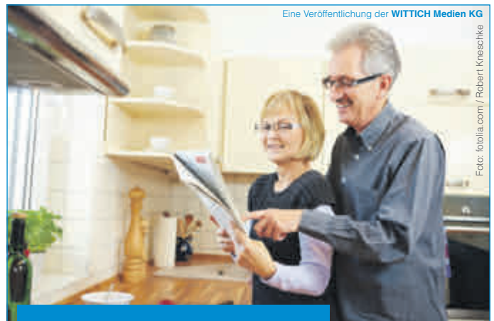
Eine Veröffentlichung der WITTICH Medien KG

Lokal informiert. Druck. Internet. Mobil.