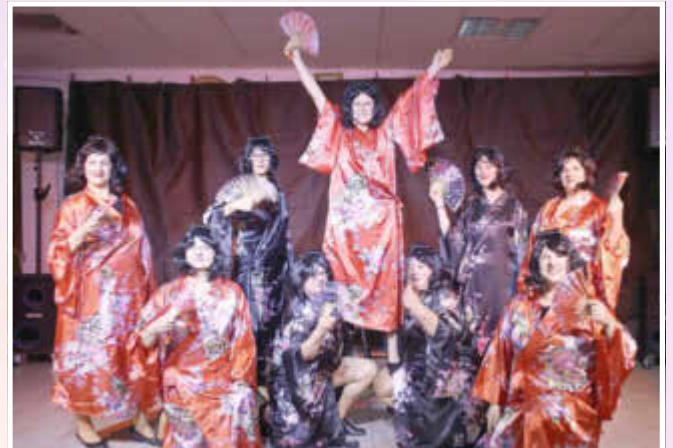
Die Japanese Girls