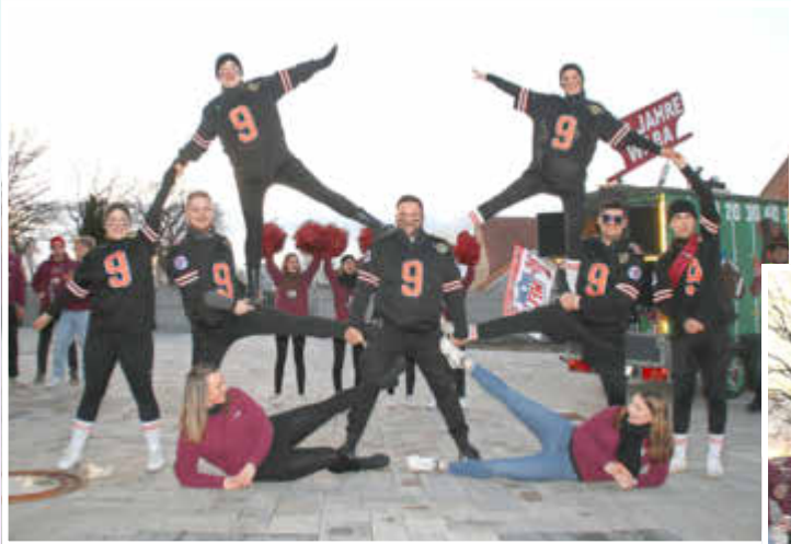
Auftritt am Kirchplatz