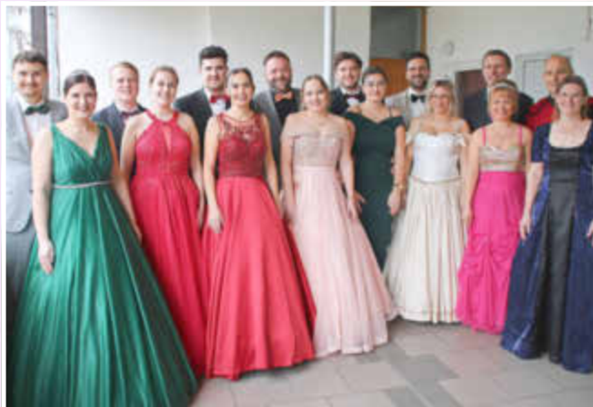
Die Prinzenpaare der letzten Jahre