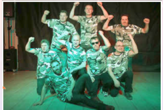
Die echten Männer