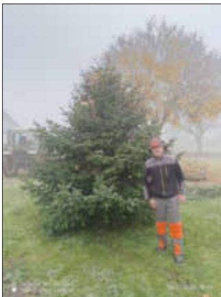
Weihnachtsbaum am Spielplatz in Ballersdorf