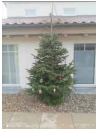
Weihnachtsbaum am Kindergarten Rohrenfels