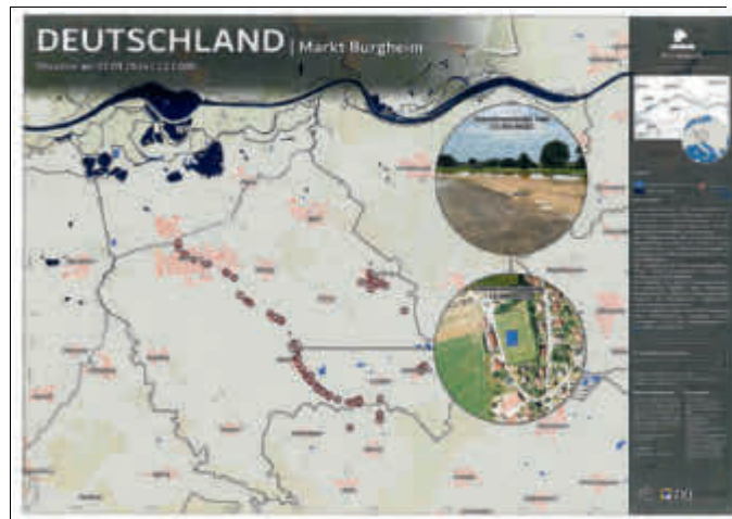
2024.10.30 - Karte EO4cam DLR zur Situation 02.09.2024 in Burgheim, Georeferenzierung der Schadensfotos

Wir danken Ihnen im Voraus für Ihre Mithilfe und Unterstützung.