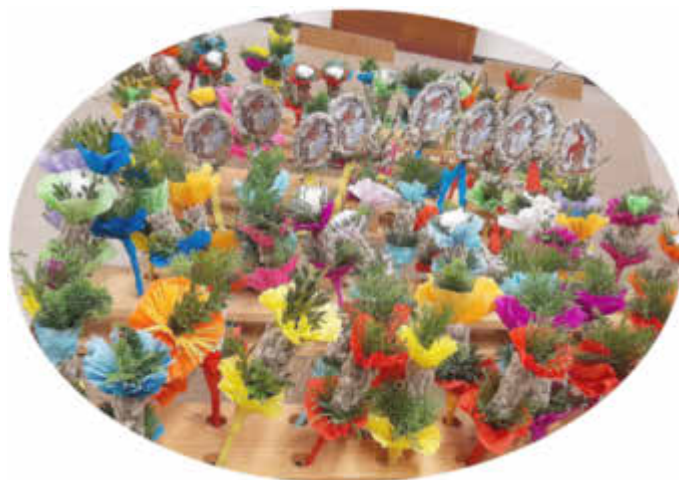
Euer Pfarrgemeinderat Wagenhofen

Herzliche Einladung an alle Mitglieder der Pfarrei St. Martin Wagenhofen zum Palmbuschen binden am Freitag, den 04. April 2025 . Um 18 Uhr starten wir mit dem Basteln im Martinsheim! Wir freuen uns auf Eure Unterstützung.