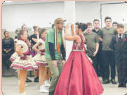
Kinderfasching in Rohrenfels