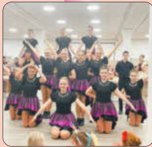
Kinderfasching in Rohrenfels