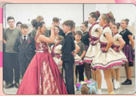
Kinderfasching in Rohrenfels