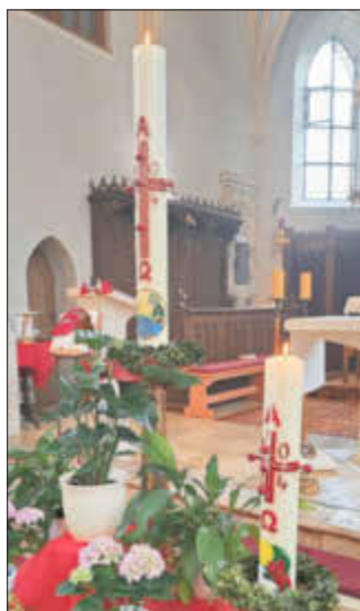
die Rohrenfelser und Baierner Osterkerze

Die Rohrenfelser Ministranten spendeten 500 € im Rahmen der Rättschaktion für die Renovierung der Orgel.