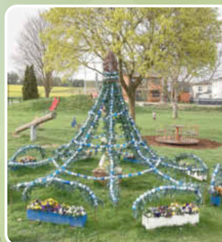
Osterbrunnen am Spielplatz in Ballersdorf