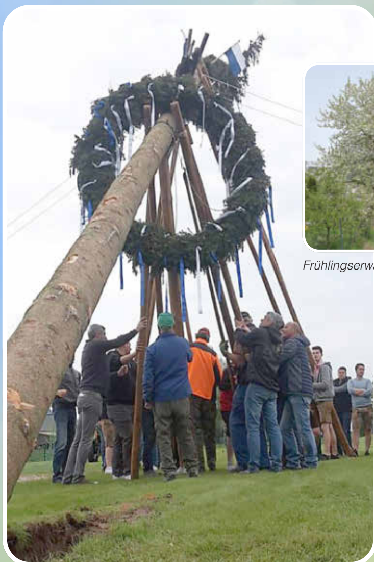
Maibaum in Ballersdorf