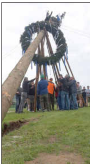
Maibaum in Ballersdorf

Einladung zum Maibaumaufstellen am 30. April 2024 in Ballersdorf