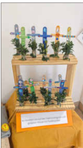
Kreuze mit Palmwedel

Die Karwoche visualisierten wir durch eine Legearbeit und unserem Erzähltheater (Kamishibai) im Mittagskreis.