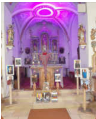
Kreuzweg der Märtyrer u. Glaubenszeugen

Abschluss dieser Quellenzeit war die Osternacht, bei der wir die Sorgenbox im Osterfeuer verbrannten. Ein schöner Abschluss bzw. Neuanfang.