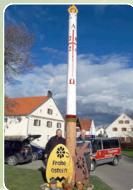
Osterkerze in Rohrenfels