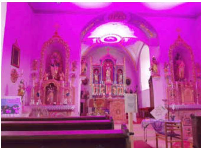
Sonja Heckl machte in der Kapelle in Ballersdorf Bibellesen für die Kinder.